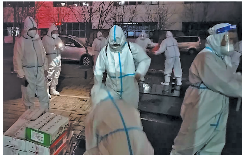
工作人员对货物进行全面消杀。