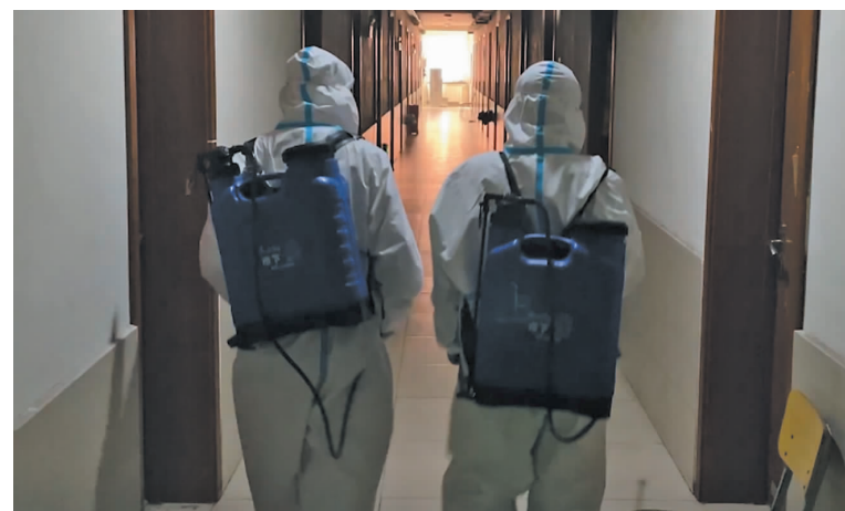
工作人员对学生公寓走廊进行环境消杀。

生命重于泰山，疫情就是命令，防控就是责任。当前，全国本土聚集性疫情呈现点多、面广、频发的特点。同学们一定要深刻认识当前疫情防控的复杂性、艰巨性、反复性，无论是在家还是在校，都要严格遵守疫情防控要求，坚定信心，坚持不懈，抗击疫情。