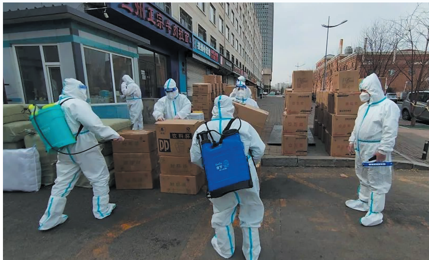
工作人员对落地货物外表面进行消杀。

领导小组组建了五组消杀小队，重点对校园出入口、教学楼、行政楼、公寓楼公共区域、学生宿舍房间、隔离房间、学生教室、实验室、实训场、粪便池、污水池、洗漱间、卫生间、垃圾点、教工餐厅、学生餐厅、超市、浴池以及校车等区域进行高频次消毒和通风，对门把手、开关、楼梯扶手、水龙头等高频接触点，通过擦拭、喷洒等方式进行多次消毒。在校园静态管理下，完成系统、全面的消毒消杀工作，做到“全覆盖、无死角、无盲区、无空白”，筑牢吉林动画学院疫情防控安全防线。与此同时，全体工作人员认真学习新冠肺炎消毒