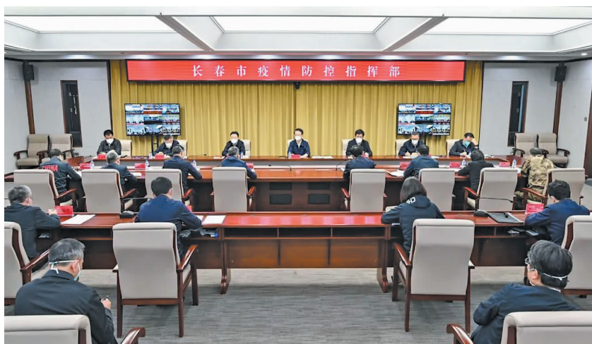
4月21日,省委书记景俊海在长春市疫情防控指挥部以视频形式主持召开工作调度会,扁平化指挥指导长春市疫情防控工作。

4月21日,省委书记景俊海在长春市疫情防控指挥部以视频形式主持召开工作调度会,扁平化指挥指导长春市疫情防控工作。他强调,要深入贯彻习近平总书记关于统筹疫情防控和经济社会发展的重要讲话重要指示精神,按照孙春兰副总理部署要求,坚持“动态清零”总方针不犹豫不动摇,坚持快、准、严、细、实,咬紧牙关、冲刺攻坚,加快推进全面清零,坚决夺取长春疫情防控保卫战最终胜利。