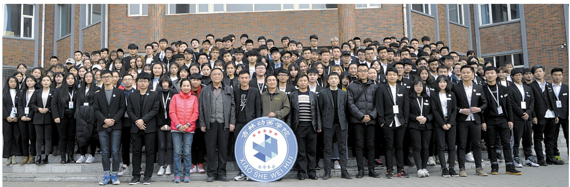
左图:2017届校舍委会全体成员合影。