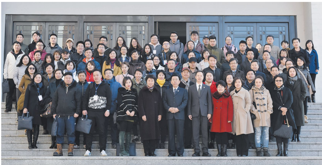
校领导与参加东北老工业基地动画游戏艺术人才培训班的学员合影留念。