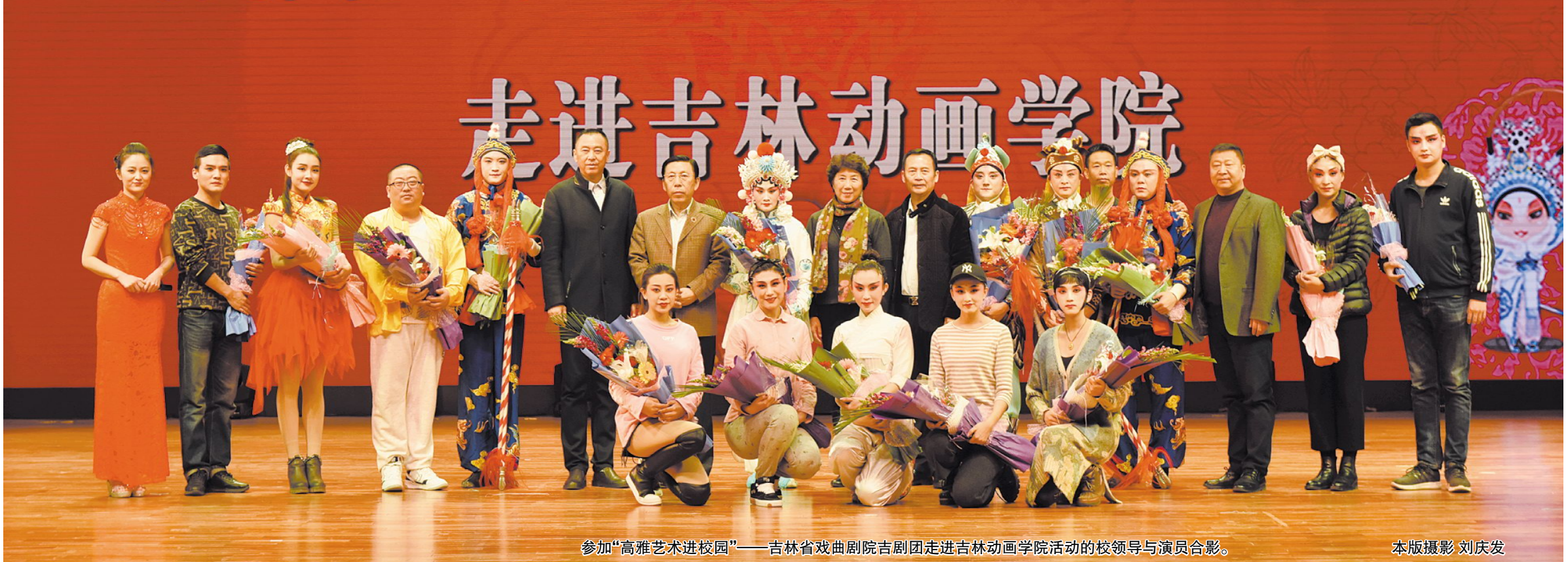
参加“高雅艺术进校园”——吉林省戏曲剧院吉剧团走进吉林动画学院活动的校领导与演员合影。