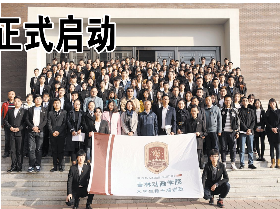
10月25日,吉林动画学院2017年第二期大学生骨干培训班启动。这是骨干班参训人员合影留念。

大会最后,盖凤明作总结发言,他希望借助十九大的东风,让学生骨干学习十九大精神,提高各方面素质,促使大学生骨干培训顺利进行。除此之外,他还对此次大学生骨干培训班提出了三点期望:第一,希望大学生骨干培训班能不断传承、发展,成为大学生骨干培训的优秀、品牌性平台;第二,希望大学生骨干努力学习,实践,不断提高培训质量;第三,希望各位学生干部能用智慧和汗水让青春更加闪耀。(高雅洁)