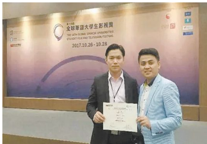
吉林动画学院代表团在第十四届全球华语大学生影视节上崭露头角。