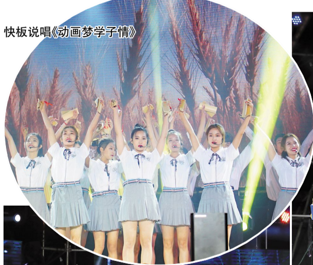
快板说唱《动画梦学子情》