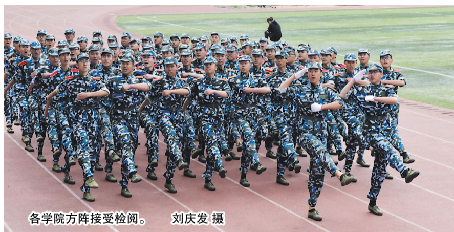
各学院方阵接受检阅。