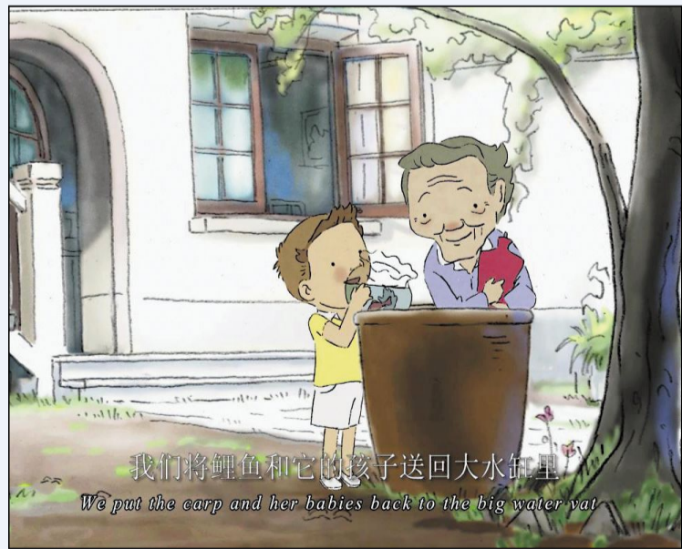
左图:二维动画短片《花儿去哪了》影片截图。

此外,作为第十一届亚洲青年动漫大赛的合作单位,吉林动画学院因组织多部作品参赛,成果突出,大赛组委会特别向我校颁发了“优秀组织奖”。(杨磊)