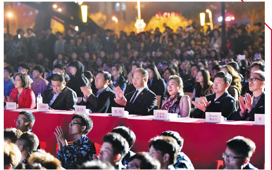
学校领导观看晚会。

本报讯 9月14日18时30分,由吉林动画学院学工部主办,校团委承办的“新的你·心动画”2017迎新大型文艺晚会在下沉式广场隆重举行。