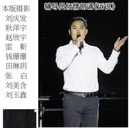
辅导员倾情朗诵《诉说》