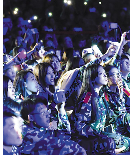
大一新生观看晚会