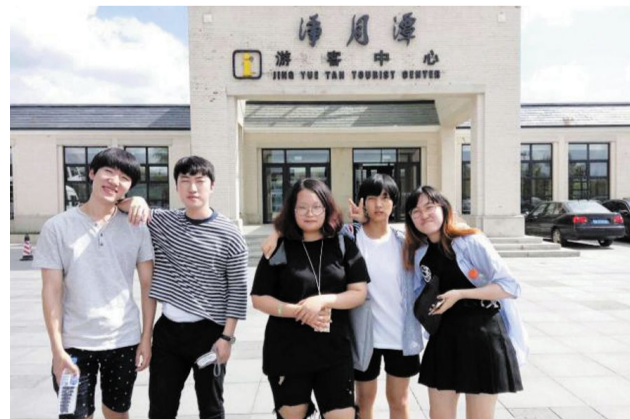
韩国留学生游览净月潭。