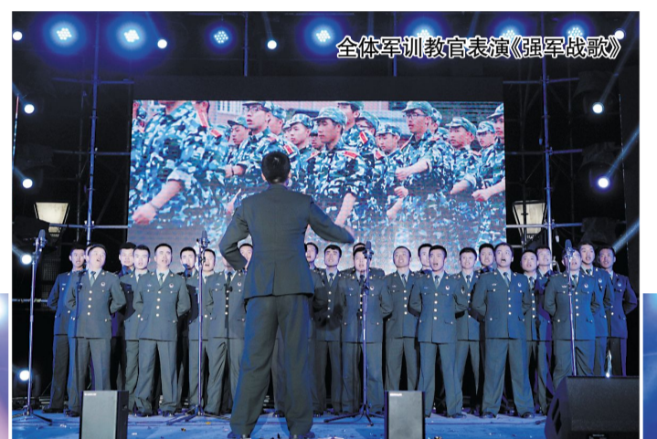
全体军训教官表演《强军战歌》