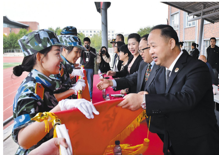
学校、部队领导为军训先进连队颁发锦旗。