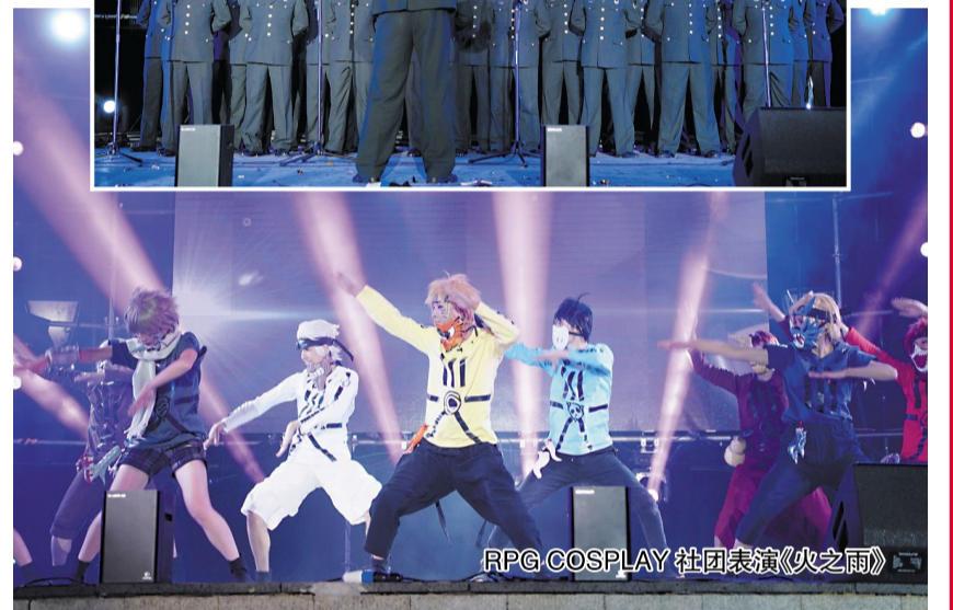
RPG COSPLAY 社团表演《火之雨》