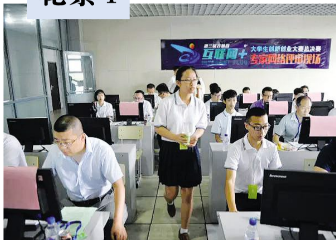
志愿者在大赛现场为参赛选手提供贴心服务。