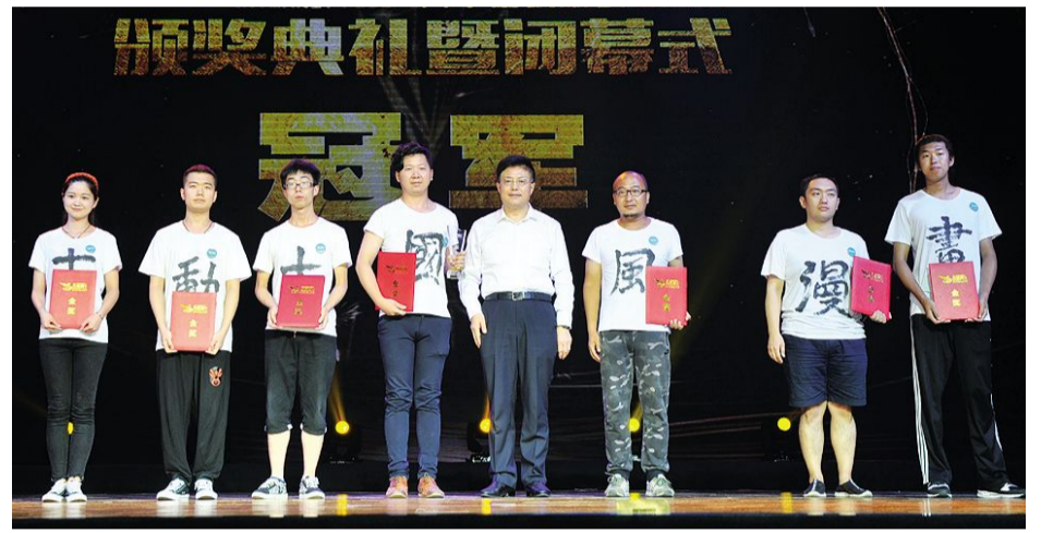
吉林省副省长李晋修为冠军吉林动画学院团队颁奖。

本报讯 7月29日,第三届吉林省“互联网+”大学生创新创业大赛颁奖典礼暨闭幕式在吉林动画学院举行。副省长李晋修出席并讲话,省政协副主席、省教育厅厅长张伯军,省政府副秘书长杨凯,省委宣传部常务副部长董维仁,共青团吉林省委副书记牟大鹏,省发展改革委副巡视员张志勇,省工业和信息化厅副厅长卢大明,省科技厅副厅长陈维友、省人力资源和社会保障厅厅长姬国海、省教育厅副厅长苏忠民、岳强出席活动。