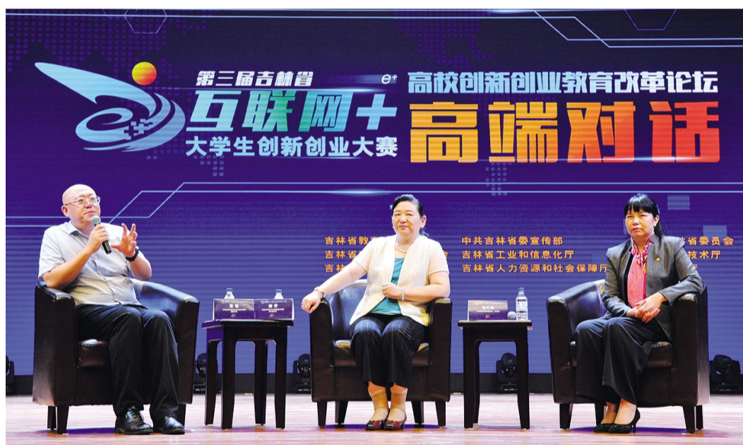
嘉宾们在高端对话环节,以问答的方式探讨中国高校创新创业教育改革。

能够生根发芽,开花结果。创业辅导体系可以支持学生项目发展,帮助创业者和创业项目找圈子、找市场、找技术、找资金,增强创业源动力,实打实的帮助创业者完成阶段性的创业目标,不断提高创业的成功率。