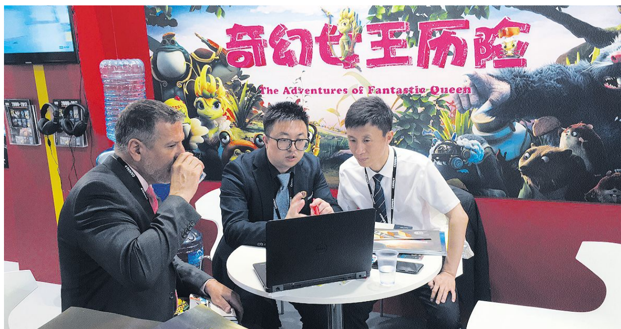
法国昂纳西国际动画节期间,吉林动画学院展区吸引了众多国外知名公司前来洽谈合作。