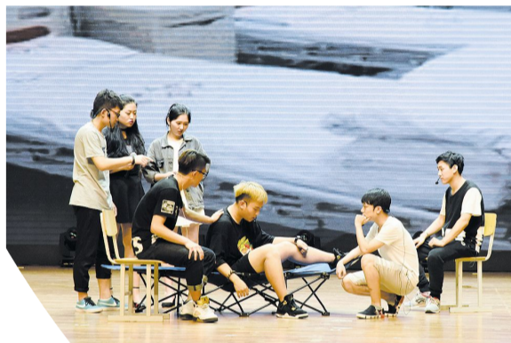
游戏学院《说》(三等奖)