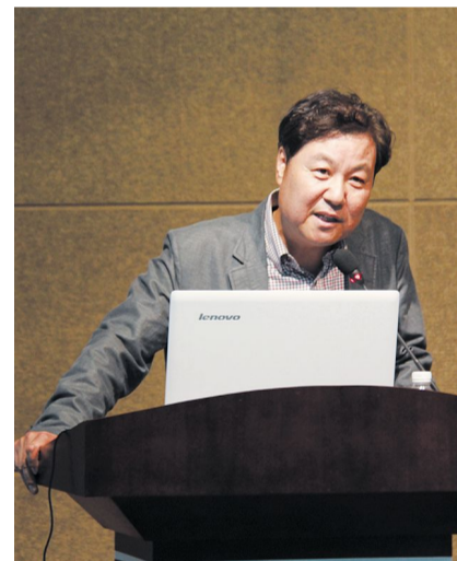
↑赵璟燮为我校师生奉献了一场独特、生动、有趣的讲座。赵璟燮与参加讲座的师生代表合影留念。

“创意”、“创意思维”,打开师生的创意思维,丰富校园文化活动,彰显了开放式国际化的办学特色,并教给了师生一种培养创意思维和思维的好方法。(赵升华)