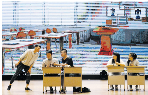
设计学院《面子》(三等奖)