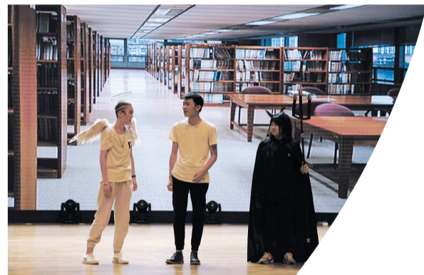
广告学院《相信未来》(三等奖)