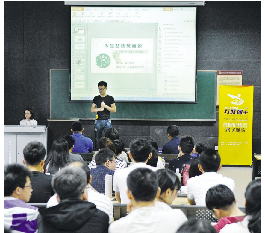
“互联网+”大会设计方案研讨展示会场。

宣讲会后, 同学们对工作室产生了极大的热情, 通过QQ交流群的方式与各位专业老师进行实时沟通, 老师也对同学们的各种疑问进行耐心的解答。 (王婵)