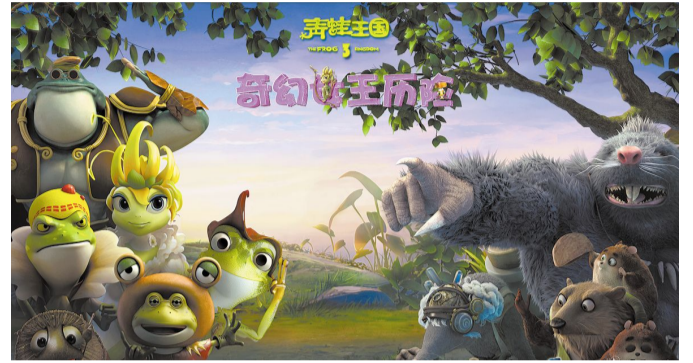
3D动画大电影《青蛙王国之奇幻女王历险》海报。

《青蛙王国》系列作为吉林省唯一一部3D动画系列大电影, 坚持打造原创精品, 始终以连贯的故事情节为主线, 阶梯式的突