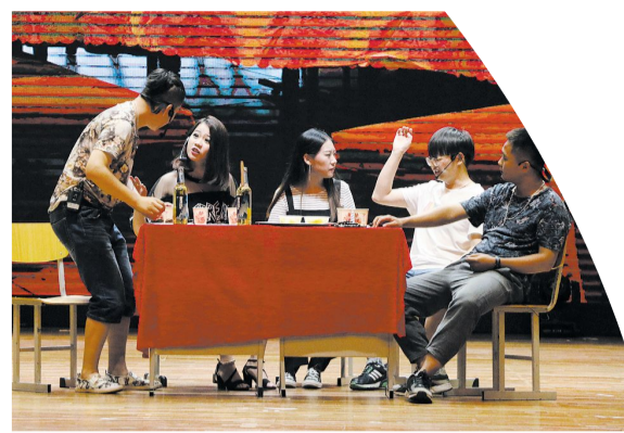
动画艺术学院《瞒》(二等奖)