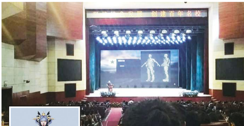
天博平台工作室宣讲会会场。