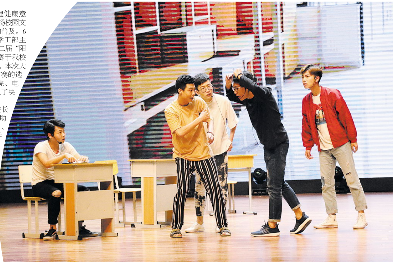
电影学院《空》(一等奖)