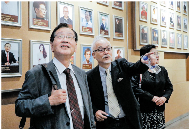
日本客人参观吉林动画学院校史馆、博物馆,对学校的飞速发展以及馆藏的作品赞不绝口。

京。由学校法人文京学园经营,同时开设有文京学院短期大学。研究生院目前设有外国语学科、经营学研究所、人间学研究科、保健医疗科学研究科。经营学研究所下设商业管理、信息管理、财务管理课程。与我校相关专业有