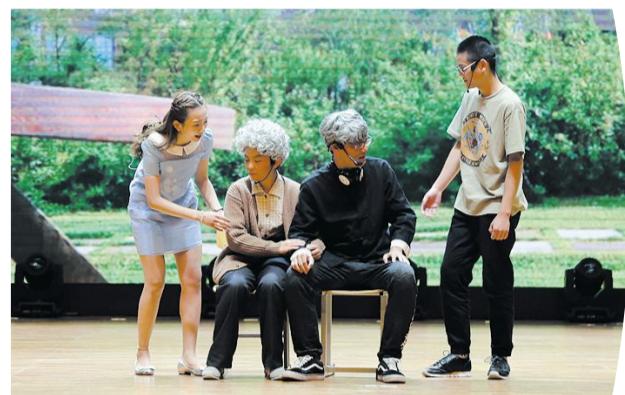
电视与新媒体学院《魔椅》(二等奖)