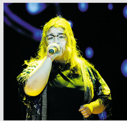
追梦路上,无怨无悔。