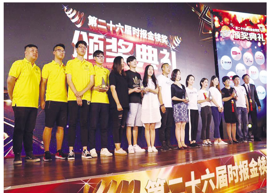
“第26届时报金犛奖”创意比赛颁奖仪式。