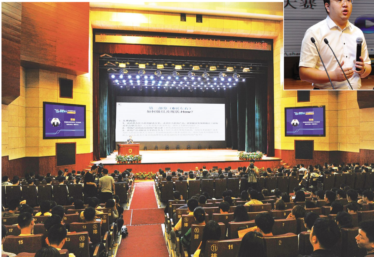
←6月19日,第三届省“互联网+”大学生创新创业大赛首期训练营在吉林动画学院开幕。

获金犛奖,为我校广告学院捧回一座国际金奖奖杯,学生们都备受鼓舞,也为低年级的学弟学妹们树立了榜样。 “校长奖”的获得可以说是与我校师生的共同努力是分不开的。今年我校广告学院共提交288件作品参评金犛奖,除了斩获一金、一银外,还有46件作品获优秀及佳作奖。在参赛作品数量和获奖等级上,在全国高校中表现突出,最终成为获的“校长奖”殊荣的五所高校之一,提升了我校广告学院专业在广告界的影响力。 “金犛奖”是全球华人地区规模最大的学生广告活动,每年都有来自世界各地的学生参与。(柴洪涛 盛伟男)