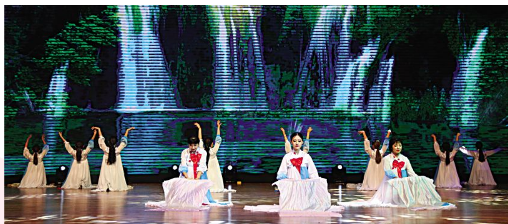
校学生会文艺部串场舞《长白山瀑布》