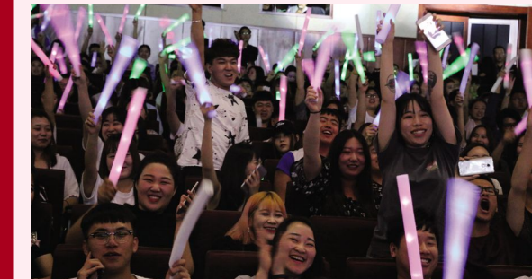
现场气氛活跃。