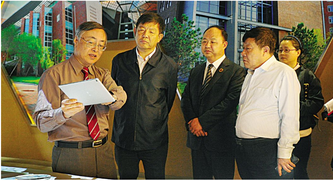
省政协促进文化企业发展调研组来我校调研。