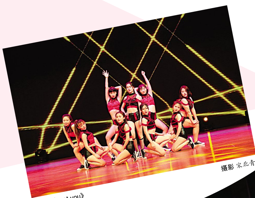
开场舞《I got you》