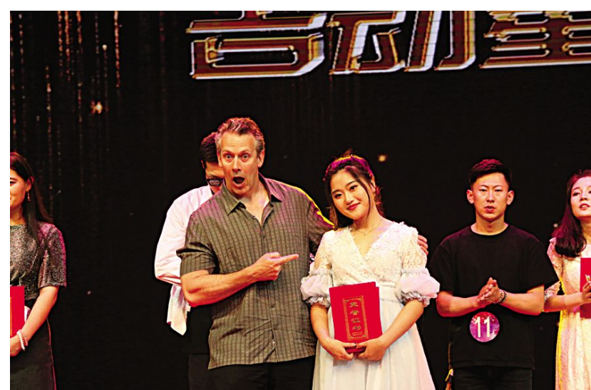
美国漫画家协会成员、MAD杂志撰稿人汤姆·里奇蒙为最佳人气奖选手颁奖。