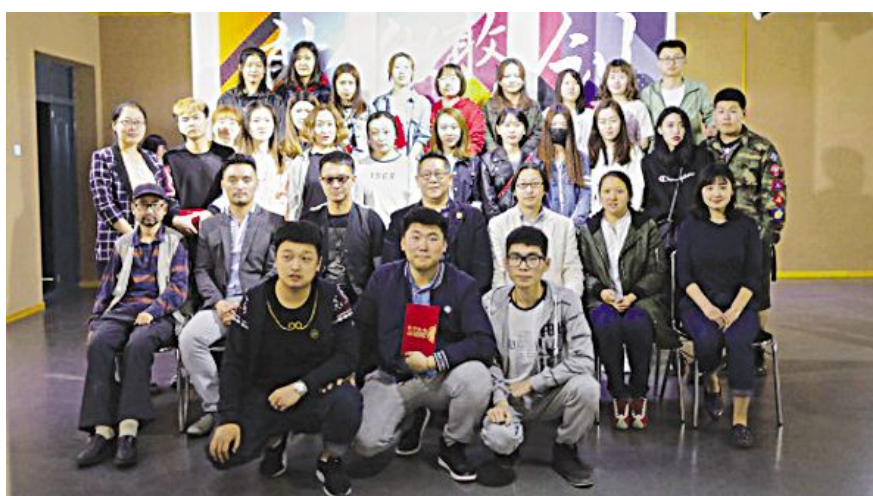
广告学院领导、老师及大赛评委与参赛选手合影。

青年创意大PK是广告学院的品牌活动，今年，广告学院积极响应学校号召，将活动与第三