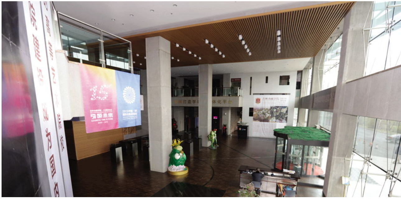
充满艺术气息的产业园大堂。

办公环境,有序便捷的管理服务,并不提高服务与管理水平。已建成了集动作捕捉系统、渲染集群系统、无纸动画系统、音效合成系统为一体的公共技术服务平台,包括2D/3D动画、游戏、设计制作设备,远程和现实实时相结合的大规模渲染、录音、拟音制作、动画剪辑、数字转高清、影像音轨合并等服务。此外,产业园正在着手建立影视后期公共服务平台,平台覆盖影视后期所需的校色、混录音棚、音乐制作、剪辑等设备和空间。