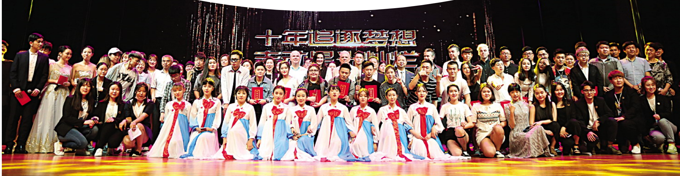
领导嘉宾与选手、演职人员合影。