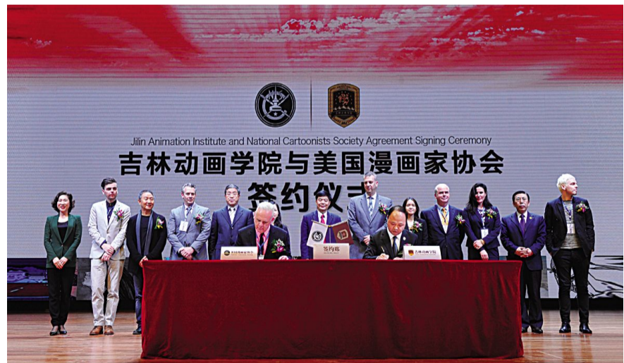
吉林动画学院与美国漫画家协会签订合作协议。

“吉林动画学院与美国漫画家协会的深度合作,将极大地推动我校人才培养和产业发展,推动我国漫画教育、文化传承创新和产业发展。”吉林动画学院院长、校长郑立国指出,希望借助漫画的独特魅力和感染力,与美国漫画家协会及国内优秀漫画教育、产业专家,共同构建动画、漫画、游戏专业人才培养的全新模式,