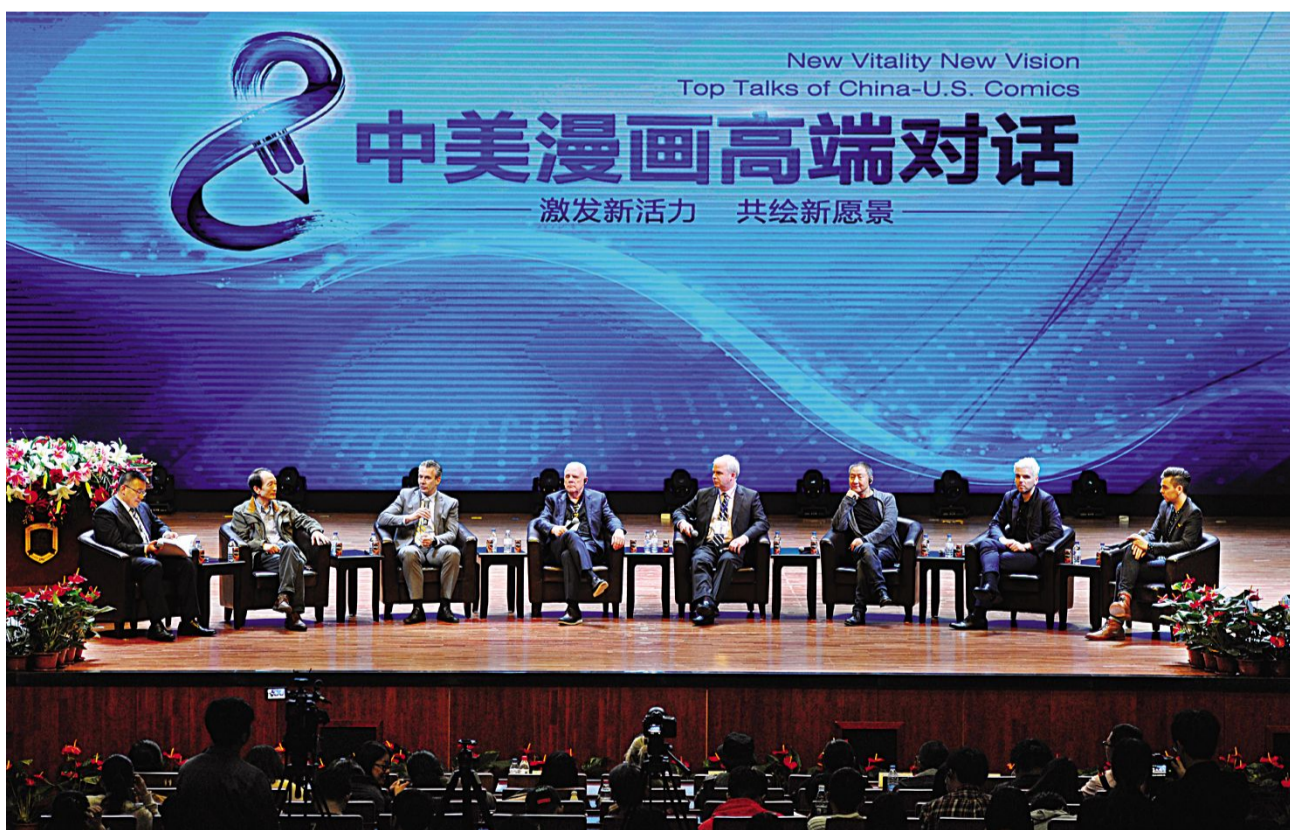
5月16日,2017年中美漫画高端对话在吉林动画学院文化艺术中心一楼国际会议厅举行。