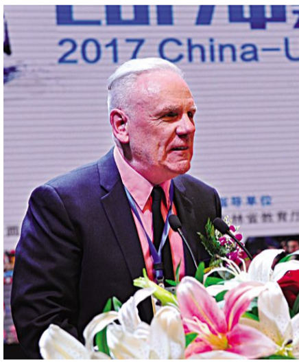
美国漫画家协会基金会主席史蒂夫·麦凯里致辞。