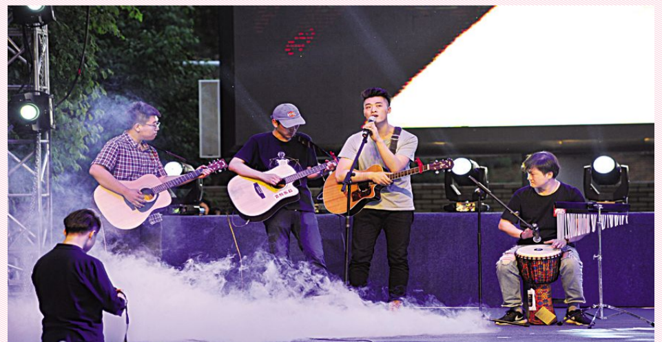
《歌曲沙画表演——民谣》