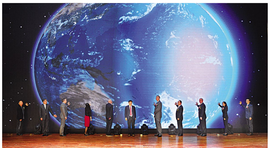
漫域 IP 运营平台正式发布。

漫域网作为吉林动画学院创办的网络平台,是中国第一大专业动漫综合门户网站。面对如火如荼的 IP 热以及与之俱增的价格,漫域网希望作为一个破题者,通过推出新的平台产品,