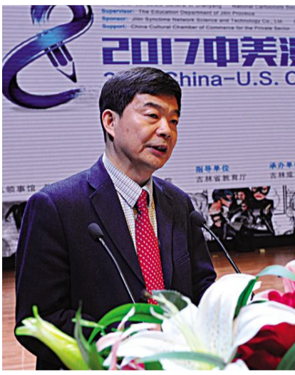
吉林省教育厅副厅长苏忠民致辞。