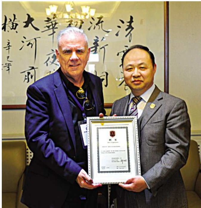
吉林动画学院院长、校长郑立国为美国漫画家协会基金会主席史蒂夫·麦凯里颁发客座教授聘书。

美国漫画家协会成员的到来不仅为我校注入了新鲜血液,为中美漫画创作激发新的创意、迸发新的灵感,产业合作开辟新的领域、派生新的价值,共同推进国际漫画教育快速发展,漫画产业繁荣兴盛!(苗露曦)