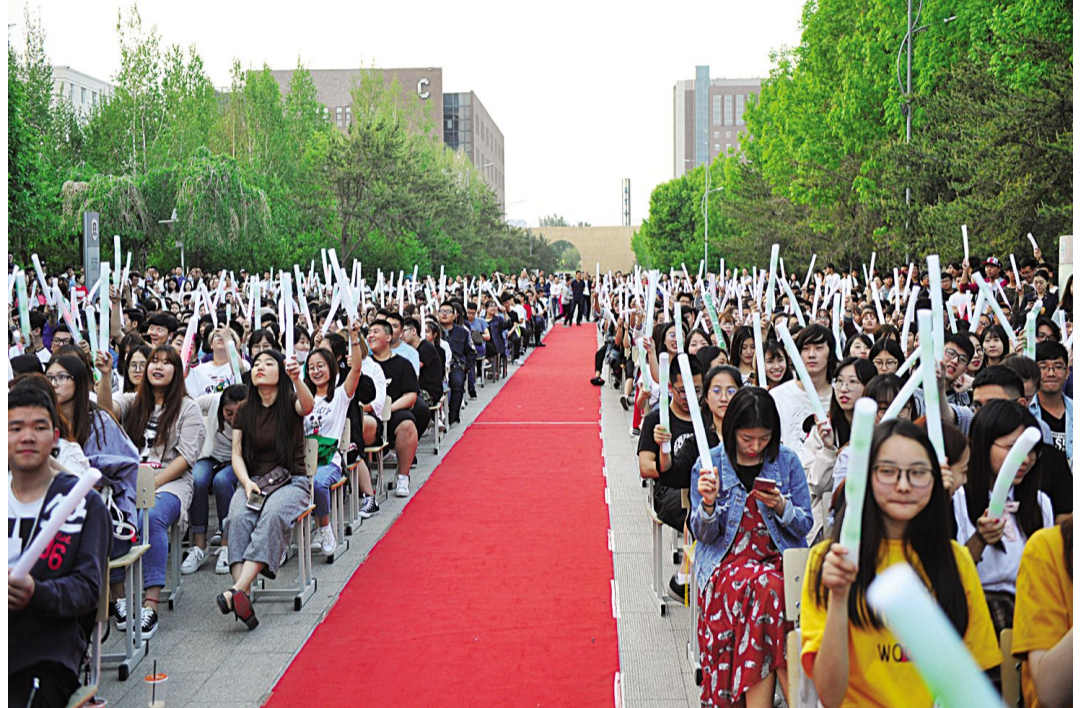
晚会现场,中央大道热闹非凡。