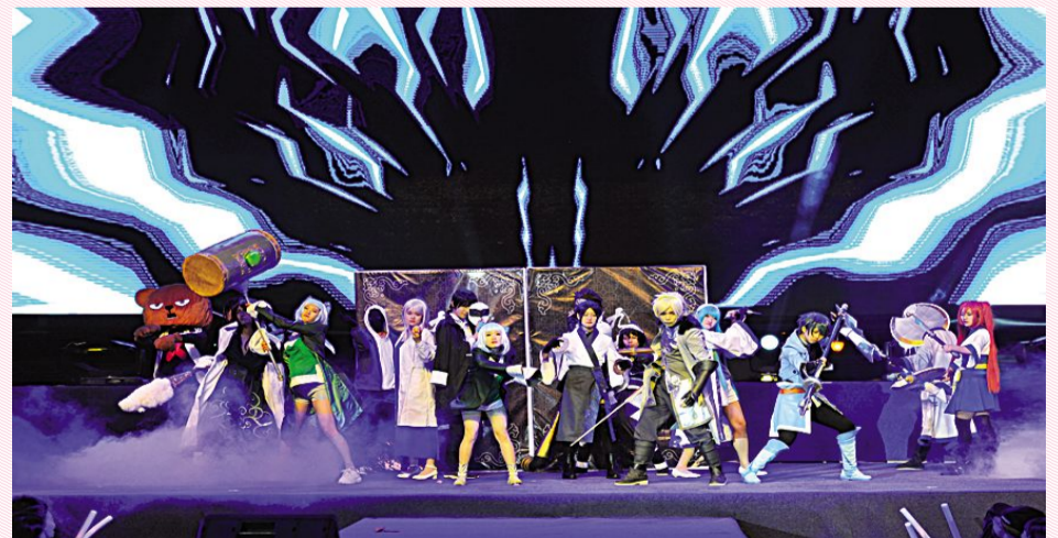
Cosplay 舞台剧《九九八十一》。