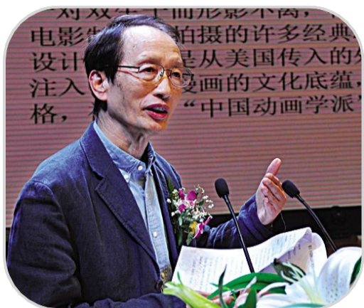
中国漫画孕育于历史,扎根于群众,成长于生活

中国的漫画形成于近代,但是追根溯源,从上古时期的历史遗迹可以找寻到中国的文明历史对中国的绘画与漫画的影响。中国的漫画来自于明清时代的木版画,一般取材自民间故事、历史人物和社会市井。二十世纪初,这种绘画作品常常见于出版物。直到1925年,《文学周报》在丰子恺的画下方注明“漫画”二字,从此,“漫画”这一画种的名称很快在社会上普及,并沿用至今。