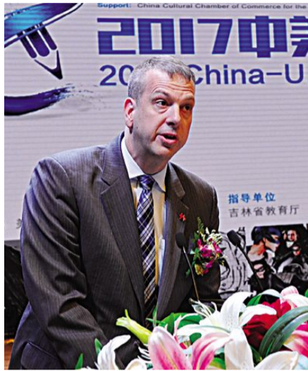
美国驻沈阳总领事馆总领事梅儒瑞致辞。