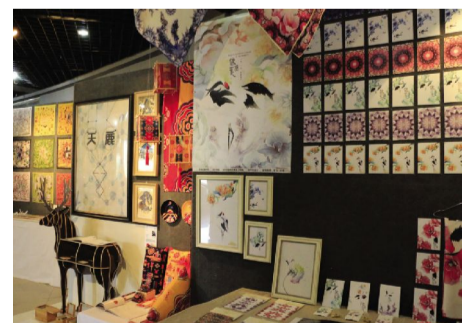
▲▼2017届本科毕业作品设计展。