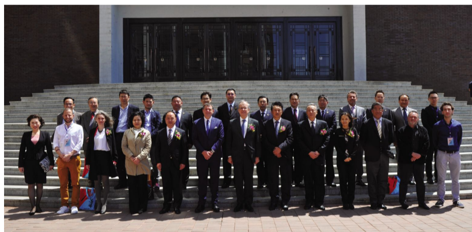
校领导与与会嘉宾合影留念。