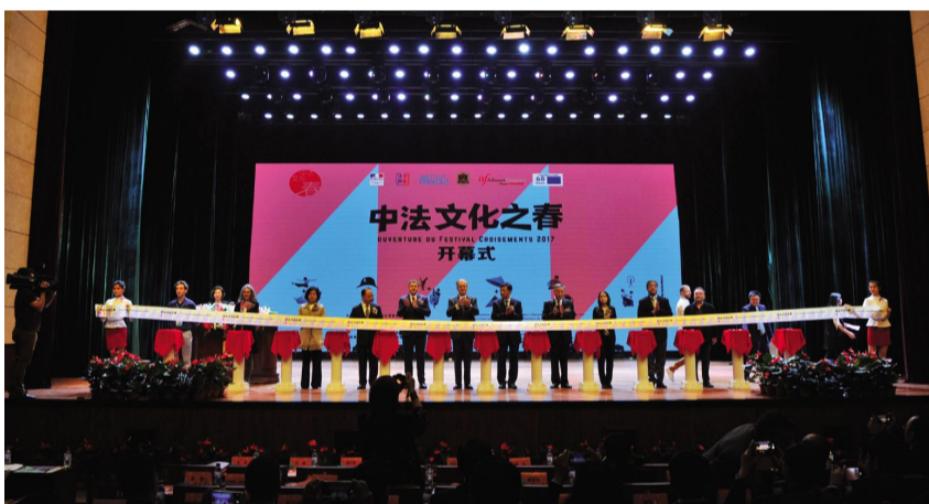
开幕式剪彩现场。

开幕式最后,与会领导共同为“中法文化之春”活动剪彩,至此一场跨越中西文化的艺术盛典在东北大地正式上演。(李冰)