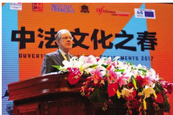
法国驻中国大使顾山在开幕式上讲话。