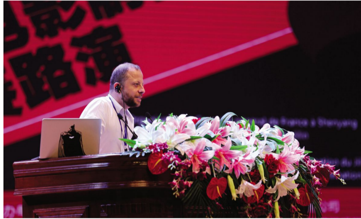
法国鸿基唐公司制片人、电影导演阿诺特·拉巴罗尼介绍48小时VR电影制作竞赛情况。