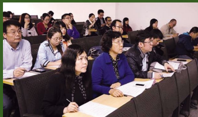
设计分院认真评选“精彩一课”

为落实学院“狠抓教学质量,提高教学水平”要求,结合评估建设需要,设计分院在“教学质量月”活动期间相继开展教师讲课比赛、优秀教案评选,举办改进教学方法和手段研讨会、新加坡淡马锡理工大学毕业生设计作品展、设计分院主题讲座等一系列活动。