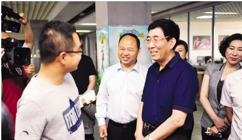
省长巴音朝鲁与张星闻同学亲切交谈