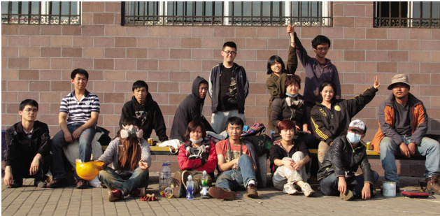
团队合影,精神饱满

都没有底,但是我们都抱着挑战自己战胜困难的态度,放弃了暑假回家陪伴家人、放松自己的机会留在学院,全力以赴开始工作。