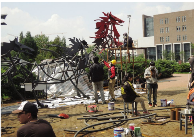
烈日炎炎,挥汗如雨

八匹骏马总重量估计有五六吨,可想而知用钢铁作为材料比之前用泥来塑造形体难度大得多。这样的项目我们还是第一次做,开始时每个人心中