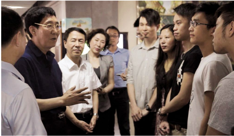
省长巴音朝鲁同香港总导演切交谈