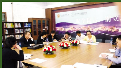
文化产业管理分院召开专题研讨会

文化产业管理分院以评估相关要求为依据,结合分院评估进展情况,落实学院“教学质量月”实施方案,制定以青年教师导师制为引领,以教师“精彩一课”为契机,通过“精彩一课”评选活动,全面提高课堂教学质量的工作方案。