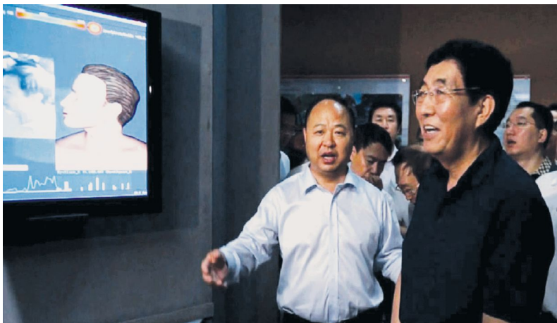
省长巴音朝鲁兴致勃勃地体验《禹硕数字动画制作面部表情捕捉系统》