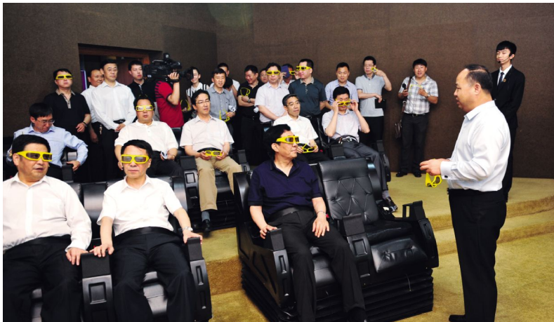
在环幕电影厅,省长巴音朝鲁观看4D动画短片《青蛙运动会》