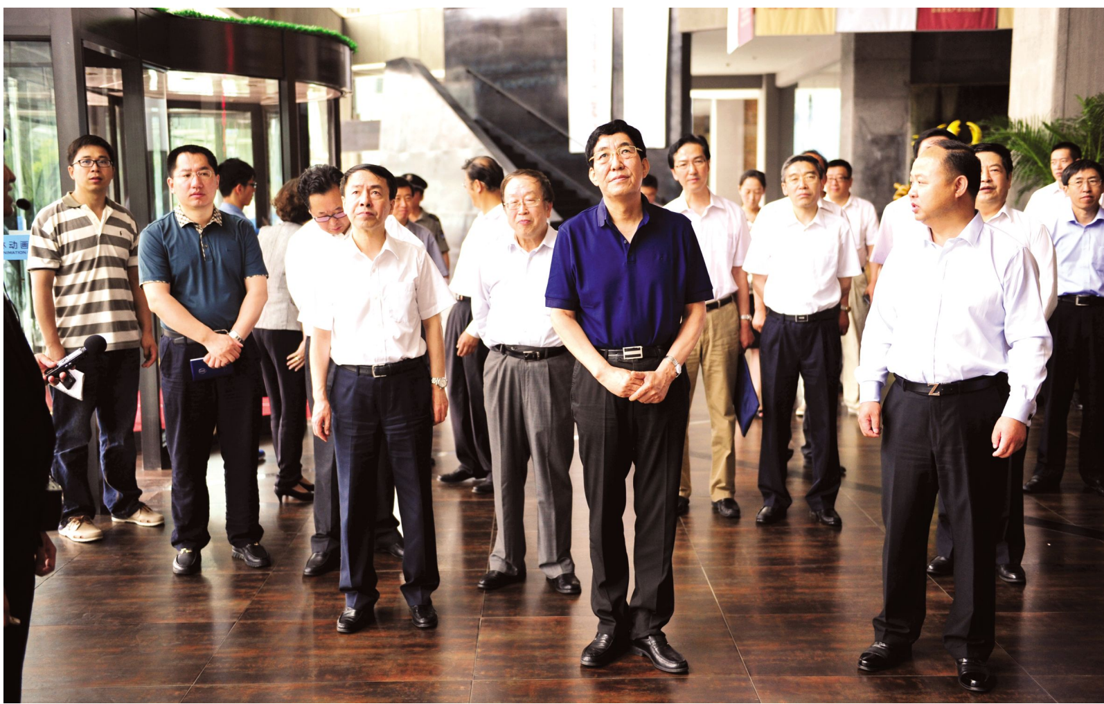
省长巴音朝鲁听取学院院长郑立国介绍我院情况

巴音朝鲁省长饶有兴致地询问了“青蛙”品牌的市场情况。听到郑立国介绍《青蛙王国》在国内电影院线已经从零品牌创造了2000万元票额的效益,在刚刚结束的法国戛纳电影节上受到欧美国家的青睐,有很多国家正在订单发行,巴音朝鲁省长频频点头,连声说,太好了,太好了。 巴音朝鲁省长非常关注动画产业的生产情况,与生产创作人员亲切地交谈,问工作,问学习,问创作感受。