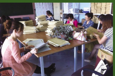
外语教学部复考试卷