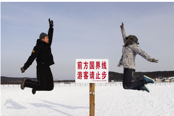
在大陆架北点撒个欢