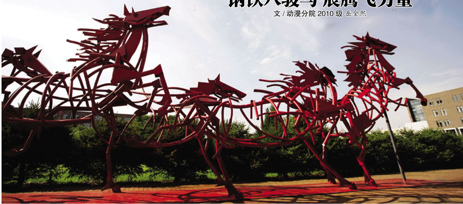
NIMO(尼莫)工作室设计制作的《钢铁八骏马》。

有人问我为什么你们NIMO(尼莫)工作室从开始组建到如今都能这么充满活力,每次做项目都倾尽全力通宵达旦,你们觉得值得吗?对这样的不解和提问我们是微笑不语,不做任何回答。