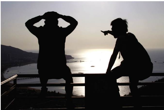
在大陆架极高点看海天一色