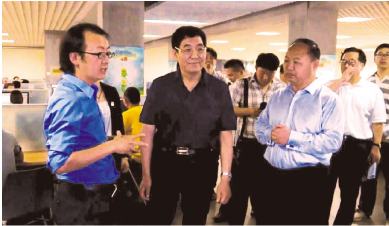
省长巴音朝鲁听取《青蛙王国》衍生品设计和生产情况汇报

吉林禹硕公司副总经理、技术总监彭飞,介绍了正在紧锣密鼓创作生产3D动画电影《青蛙王国II》《青蛙王国III》的情况。巴音朝鲁省长环顾繁忙的工作室,被正在紧张创作的一幅幅动画作