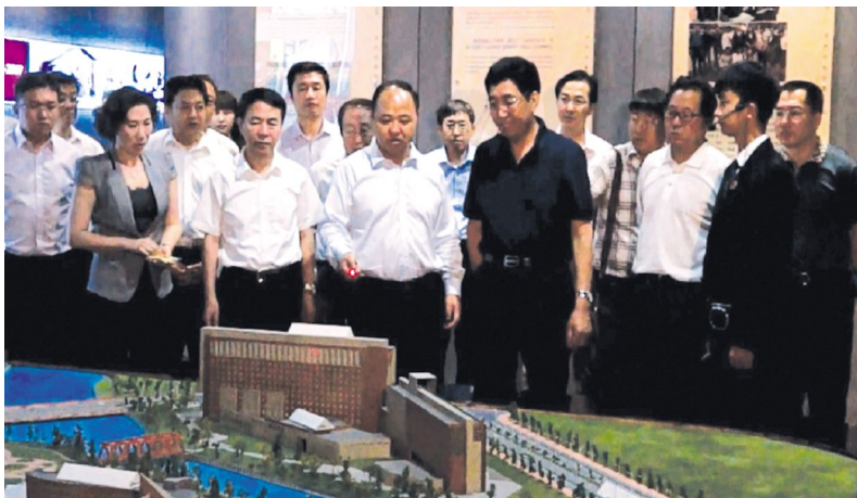
省长巴音朝鲁观看我院沙盘模型