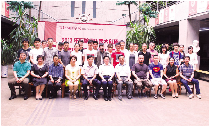
学院领导与获奖学生、指导教师合影

本报讯(教务处 王彬) 6月5日上午,2013年度大学生创新创业训练计划项目院级优秀项目颁奖仪式暨成果展开幕式,在学院图书馆二楼大厅隆重举行。