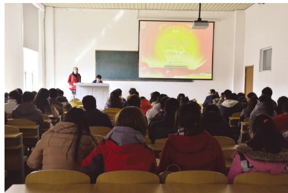
入党积极分子教育培训场景

教育培训后,入党积极分子进行了分组讨论和义务教育。本次教育培训,进一步激发入党积极分子入党的热情和积极性。培训后,同学们纷纷表示要在学习、生活、工作上严格要求自己,做一个有理想有抱负的大学生,争取早日加入中国共产党。