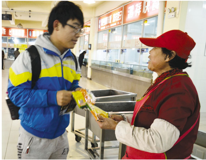
志愿者向保洁员阿姨赠送清洁胶皮手套

讲文明、树新风,让雷锋精神吹遍校园。3月5日,由我院勤工助学组织——阳光社的学生们组成的志愿团队纷纷行动起来,如火如荼地开展了“谁是校园里最美的人”关爱校内务工人员爱心公益活动,感受雷锋精神,弘扬雷锋精神,践行雷锋精神,释放青春正能量。