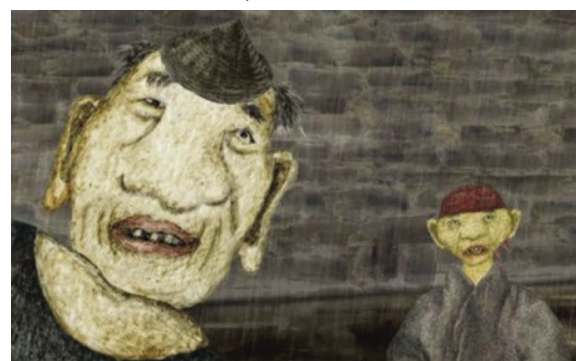
《长城脚下的小池塘》剧照

荷兰国际动画节(HAFF)创办于1985年,由荷兰动画电影节基金会主办,是荷兰唯一的大型动画节,也是世界上重要的动画节之一。HAFF是两年一次的双年展,宗旨为展示国际间动画的质量和多样性,从传统动画到电脑动画,从前卫派到卡通,将影片或动画做一个概览,同时也有怀旧与主题式的历史性节目、展览、脱口秀等,包括应用动画竞赛、短篇动画竞赛(叙事及非叙事影片)以及AnyZone(不分领域)竞赛等单元。