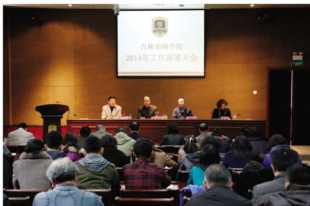
2014年工作部署大会现场