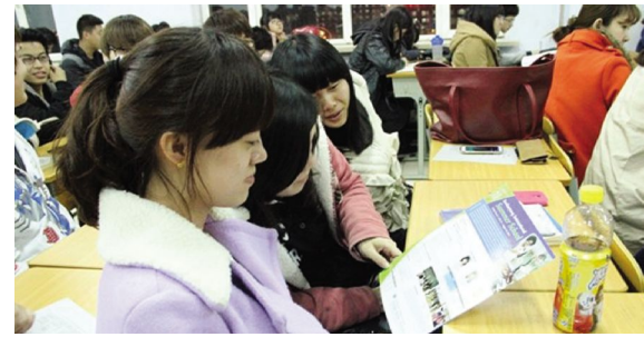
文化产业管理分院学生在阅读相关资料

本报讯(国际合作与交流中心)为加深学生对学院留学求学项目的了解,开阔学生的视野,拓宽留学求学渠道,为每位学子量身定做最佳留学求学方案,提供手把手、心贴心的留学求学服务,国际合作与交流中心从3月10日起在各分院举办留学求学宣讲会。