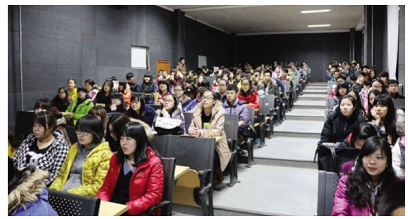
传媒分院学生认真听取留学求学情况介绍