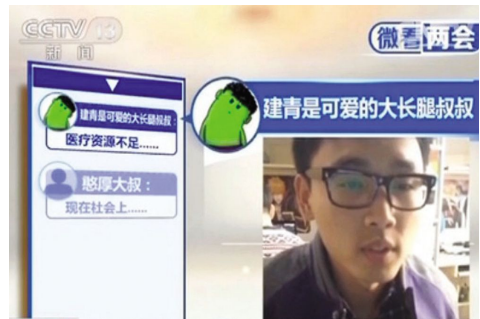
“两会”互动微拍视频被收录央视《新闻30分》中