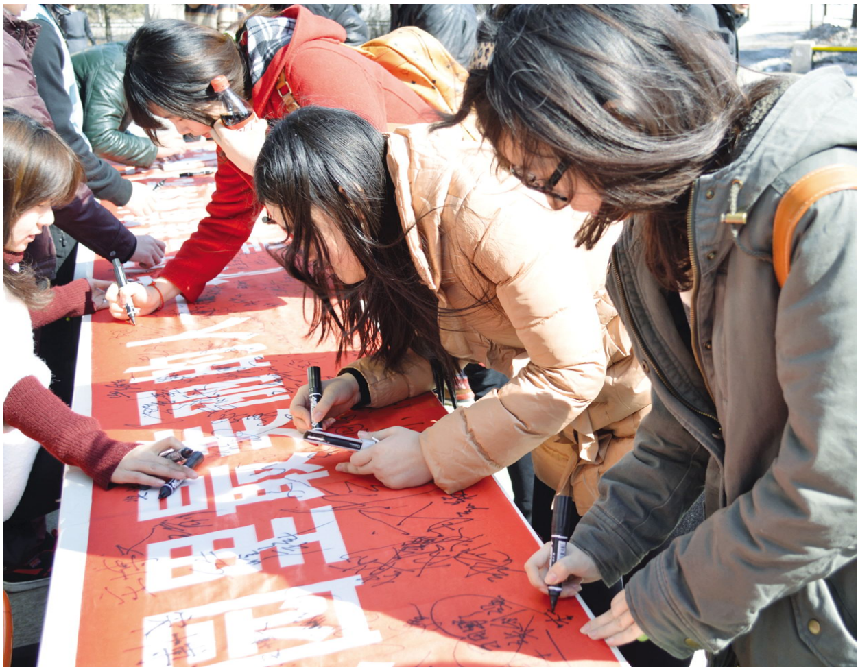
在活动宣传条幅上签名,留下一份庄严承诺