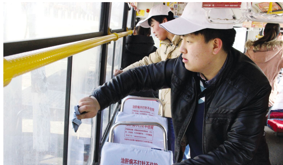
比一比,看看谁擦得亮

找失主,许多师生拾到物品也能主动上交保卫处。保卫处还在网站专门开设了失物招领栏目。失主们面对失而复得的物品开心的笑了的时候,也是保卫处全体人员最为欣慰的时刻。 (保卫处)