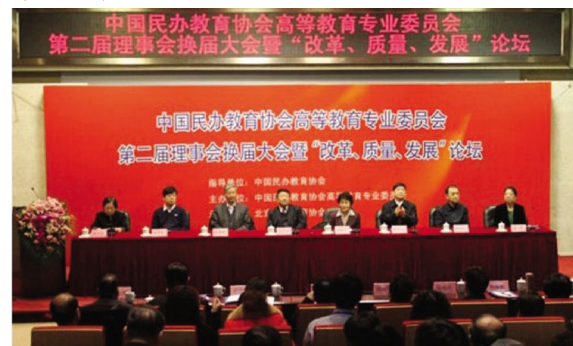
会场场景

新闻链接: 中国民办教育协会是我国民办教育领域第一个经过法定程序由政府正式批准成立的全国性组织,是由全国各级各类民办教育机构和民办教育工作者自愿组成的群众性、行业性、非营利的社会团体。 中国民办教育协会的宗旨是广泛团结全国民办教育工作者,面向社会开展民办教育科学理论与实践研究,开展行业自律、行业维权与其他行业服务活动,为广大受教育者服务,培养社会主义建设者和接班人,提高劳动者素质,促进中国民办教育健康发展。