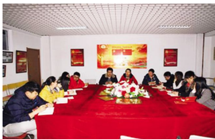
践行雷锋精神讨论会场景

学院保卫处一直以为学院广大师生服务为己任,除了做好各项服务保障外,还积极响应学院的号召,开展学雷锋讲奉献活动。 保卫处的保安员、楼管员一直都有拾金不昧的优良传统。他们在日常巡逻、清楼过