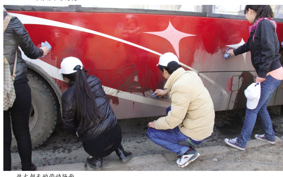
热火朝天的劳动场面