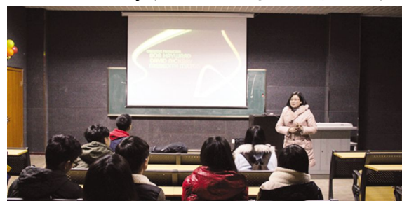
观影活动场景

本报讯(游戏与数字媒体分院团委 黄玉姝)青春展翅,梦想起航。3月7日18时,游戏与数字媒体分院第一届女生节观影活动在F楼202室举行。