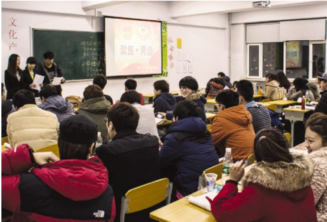
“两会”互动微拍视频被收录央视《新闻30分》中

本报讯(文化产业管理分院团委学生会)全国政协十二届二次会议和十二届全国人大二次会议开幕后,文化产业管理分院团委学生会分别于3月5日、3月6日召开“聚焦两会”为主题的学习会,会后同学们通过网络、报纸、电视等媒体,关注“两会”进程,了解“两会”动态,学习“两会”精神。