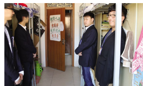
检查学生寝室卫生

在今年“学雷锋纪念日”到来之际,游戏与数字媒体分院团委学生会“哈雷一族”全面清扫分院所属教室、工作室及办公区卫生,深入寝室宣传安全文明、禁烟知识,宣传动员“学雷锋精神,做好人好事”,以实际行动向雷锋学习,营造志愿服务的良好氛围。 3月5日中午,游戏与数字媒体分院团委学生会全体成员带着清扫工具,来到产业大厦3楼、F楼各个楼层清扫卫生。尽管天气寒冷,但所有人都情绪高涨,忙活得满身是汗却没有任何抱怨。因为大家心里清楚,身为团委、学生会的一分子,就应该具备默默奉献的雷锋精神,就要身体力行做好同学们的榜样,从学生骨干层展现“雷锋精神”,进一步提升分院学生的奉献精神和责任意识。经过一个多小时的努力,卫生清扫任务顺利完成。 下午,学生会生活部分组前往学生寝室进行