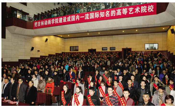
表彰大会现场