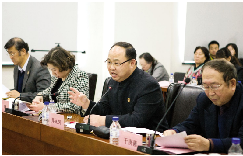
检查组在学院领导陪同下进行检查验收