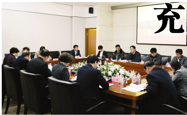
党建工作预评估汇报会现场

最后,检查验收组进行了检查反馈,对我院依法治校工作所取得的成绩给予了高度评价,认为我院对依法治校工作高度重视,做到了有计划、有措施、有成效,学院章程、治理结构、权益保障、依法办学等工作取得了丰硕成果,特别是在推动我省文化产业发展 and 人才培养方面做出了