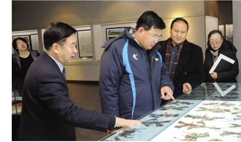
考核组参观我院博物馆