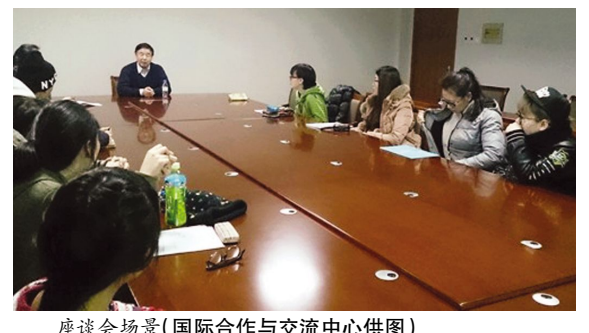
座谈会现场

参加座谈会的同学们纷纷表示将珍惜这次学习机会,刻苦学习,不辜负家长和学校的期望,争取获得优异成绩。