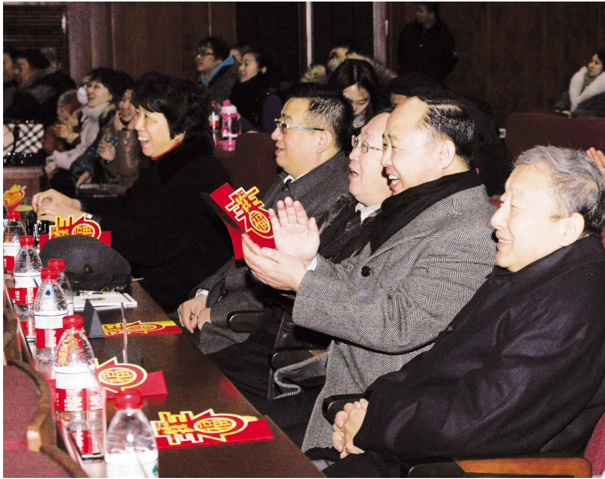
师生们的精彩表演，博得了郑立国董事长、院长等领导们的热烈掌声。