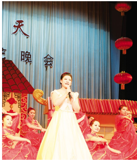
郑婷婷演唱《踏歌起舞》