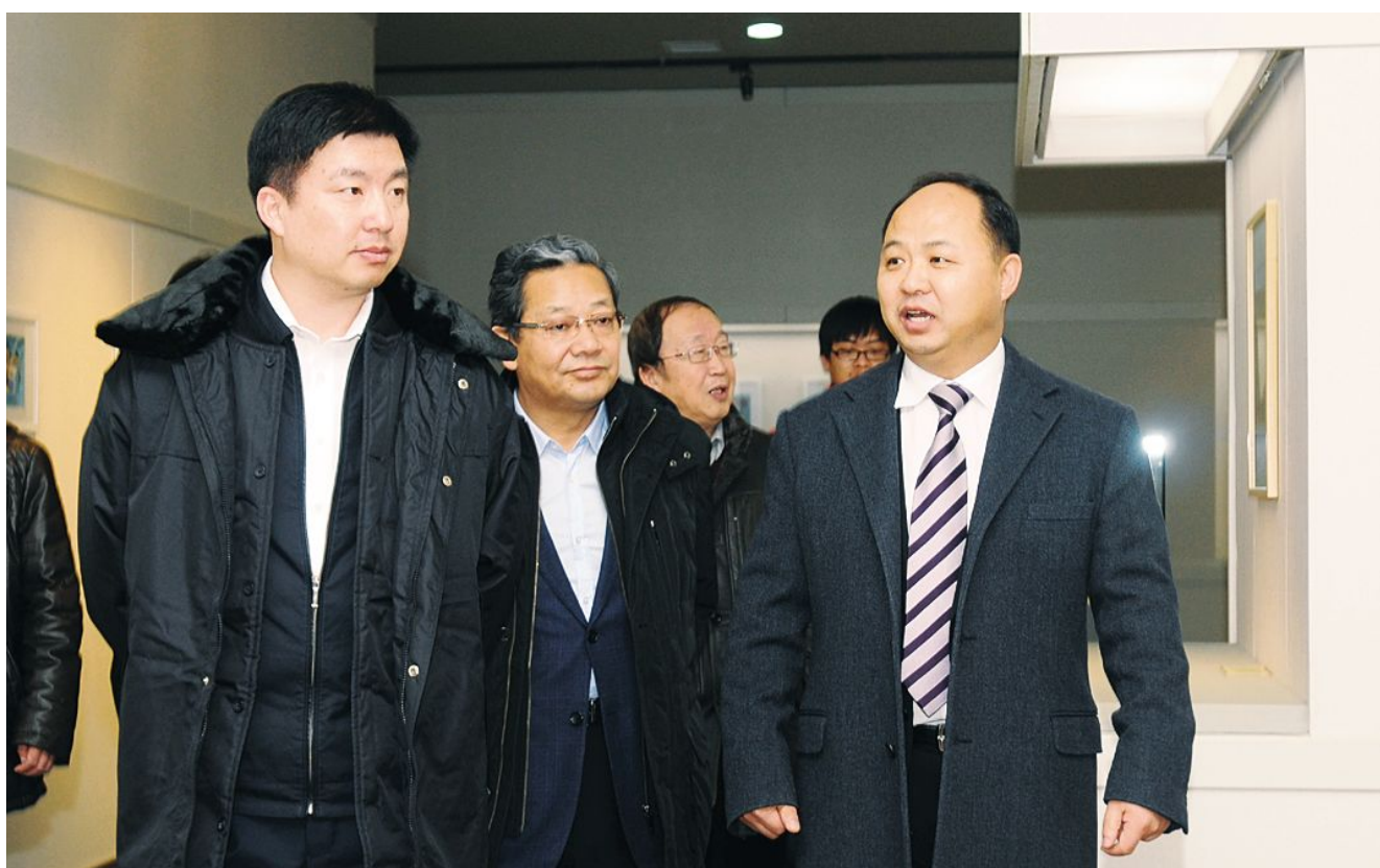
吉林省委常委、宣传部长庄严,吉林省委宣传部常务副部长姜凤国等在我院调研。

在吉林禹硕长春影视公司,庄严一行颇有兴致地走进生产车间,认真了解创作流程和经济效益。学院董事长、院长郑立国介绍,学院不断强化科技创新对教育和文化产业的支撑和推动作用,坚持教育和创意产业共同发展的思路,形成了教育教学、技术研发、产品开发、市场营销四方面的有机结合。吉林禹硕长春影视公司积极推进生产