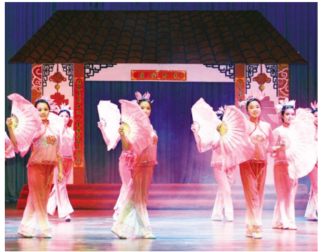
学生表演舞蹈《茉莉花》