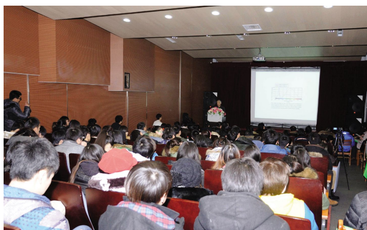
“光演绎的空间”照明设计长春论坛在我院举办。

来自东北地区的艺术及设计学院师生、企业设计师,以及活动合作单位三雄·极光照明的代表等200多人参加论坛,交流设计教育理念与方法,畅谈设计创新思维及激励方法,共同推动中国建筑和环境艺术设计快速发展。