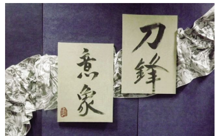
《刀锋—意象》美术作品展

刀锋的滑动闪现出了无数个艺术的情影,在这里,我领略到数字艺术的诱人魅力。通过作品,我看到了游戏分院的美好未来,相信游戏分院的2013更加灿烂辉煌。