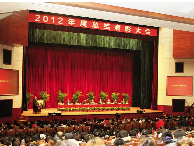
学院 2013 年度总结表彰大会大场景。

回顾 2012 年的全面工作,吉林动画学院秉承“自尊、自强、创新、创造”校训精神,坚持“开放式国际化、产学研一体化、创意产品高科技化”三大办学特色,教学改