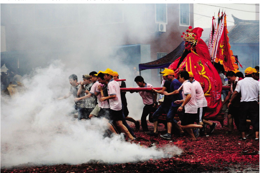
右上图:《农家乐》 右图:《笑在脸上 孝在心》 下图:《开漳圣王》

传媒分院摄影系教师李君说:“举办本次彩色摄影作业展目的是给学生营造一个相互学习交流的氛围,希望他们取他人之长,补自己之短,在交流中进步。84张作业中没有好差之分,在我眼里都是一样的。”