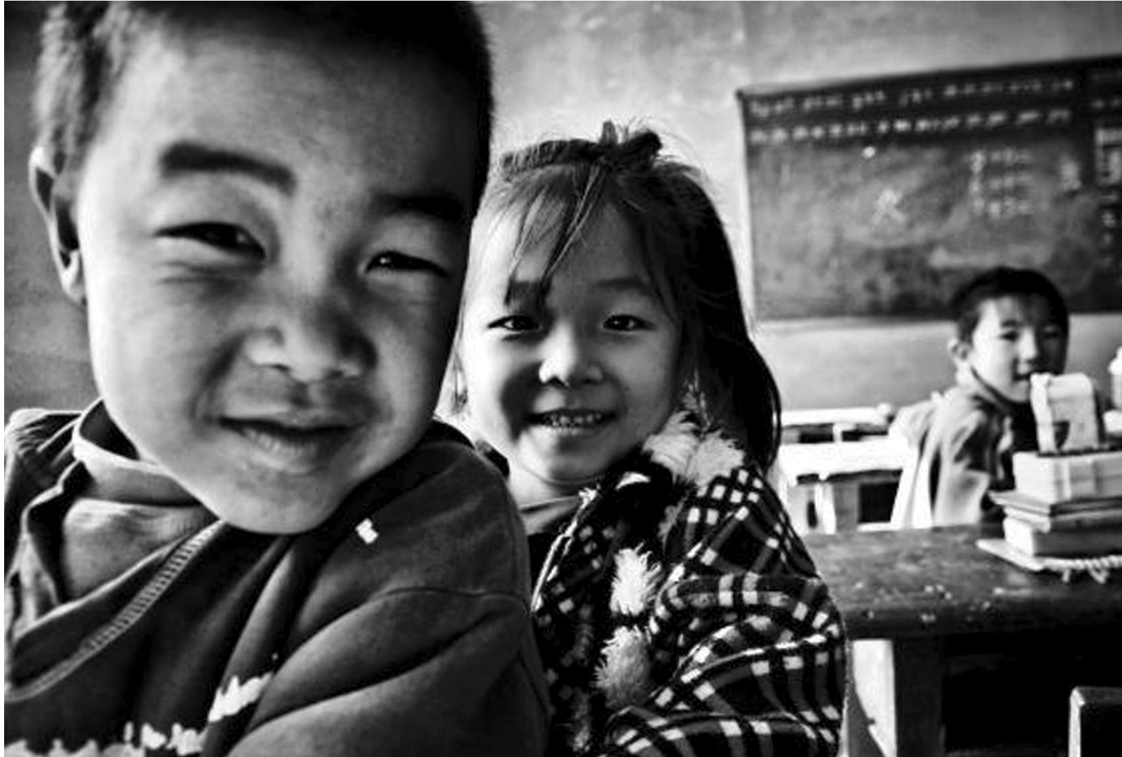
《我爱上学》组照之一。

奖、优秀社团二等奖,实现了摄影系教学质量在省内夺得排头兵又进军全国的梦想。”上官高翔在谈到创作体会时说:“我是大四学生,我的责任是关注社会,关注人生。如果能为社会的进步与改革做出贡献,那将是我梦想。”