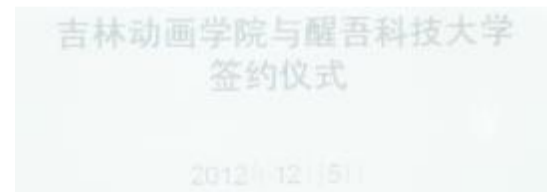
吉林动画学院与醒吾科技大学签约仪式

醒吾科技大学以“忠诚勤和”为办学理念,以“教授应用专业知识,养成实用专业人才”为宗旨,培养商科优秀学生,目前有研究所、大学部、专科部、进修(夜间)部、进修学院、进修专校等。