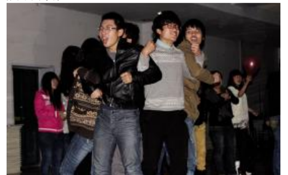
广告分院室内素质拓展活动现场。

本次素质拓展由广告分院团委、学生会实践部全程组织、策划、实施,共有80余人参加。活动设置了“背夹气球”、“瞎子背瘸子”、“坐地起身”、“背筐接沙包”、“乒乓球接力”等比赛项目。活动中,各小组成员团结协作,热情高涨,欢声笑语持续不断,幸运抽奖和才艺表演环节更是将整个活动推向了高潮。