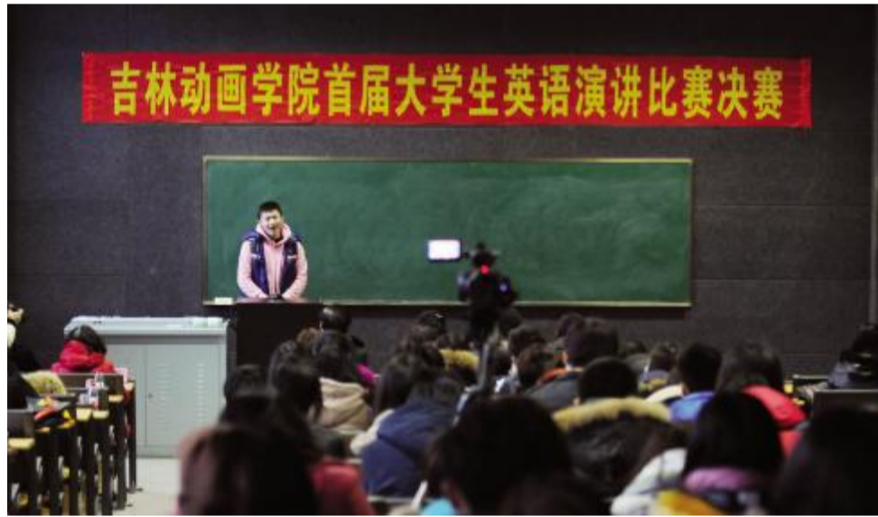
首届大学生英语演讲比赛场景。

本报讯(叶翠翠)12月12日,由教务处、学工处、外语教学部联合主办的吉林动画学院首届大学生英语演讲比赛在F楼106圆满落幕。15名佼佼者从300多名报名者中脱颖而出,用流利的英语为现场观众带来了一场精彩的听觉盛宴。