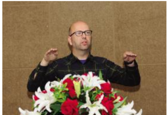
保罗·丹尼森为设计分院师生做报告。

英国提塞德大学位于英格兰东北部约克郡那来德尔斯堡市,是一所综合性公立大学,以教学质量著称。提塞德大学由商学院、计算机学院、健康与社会保健学院、科学与技术学院、艺术与传媒学院、社会科学与法学院组成。专业设置有设计、计算机、电机/电子工程、历史、动漫、电脑游戏、商科、管理、教育、土木工程等。