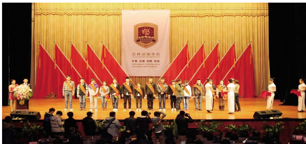
▲2012 年学生先进集体、先进个人表彰大会场景。