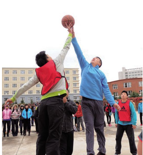
赛场拼搏紧张激烈。

本报讯(学院工会)由学院主办、学院工会和公共基础教学部共同承办的学院第三届教职工篮球友谊赛,经过五天八场次的激烈角逐,10月19日圆满落下帷幕。这是继今年春季第三届教职工排球友谊赛之后,学院开展的又一次全院教职工广泛参与的球类比赛活动。