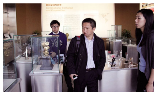
英国布拉德福德大学代表在我院参观。

布拉德福德大学约有在校学生10000人和教职员1800人,78%的学生在攻读本科课程。学校设有工程学院、科学院、医学院、社会科学和自然科学学院等,经济管理学科名列全英前10位,在工程学、健康学和商业与管理学上的成绩也很明显。学校开展了很多创意课程,比如考古学、和平研究、电子图像和媒体通讯、控制论、技术管理、医学工程和跨学科人文科学等。艺术类专业设置有计算机动画制作、游戏开发、设计。