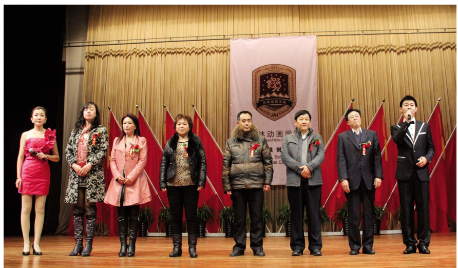
获奖学生家长在台上接受学院领导和师生的敬意。