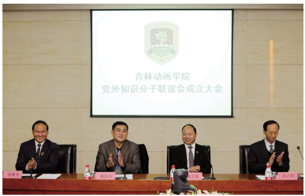
学院党外知识分子联谊会成立大会场景。

郑立国会长在讲话中希望全体会员加强学习,利用学院教育、科研和产业平台,全面提高自身素