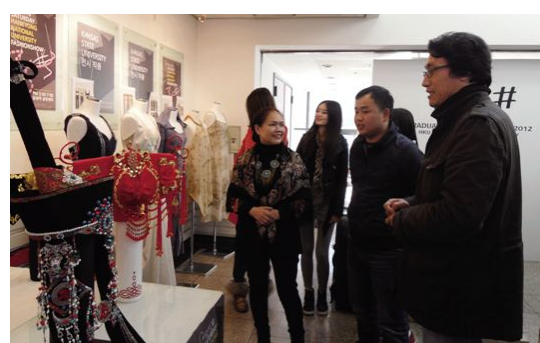
设计分院作品在韩国参展。

本报讯(设计分院)11月8日,设计分院应韩国韩国大学邀请,赴韩国参加2012年韩国大学服装专业毕业生作品展。