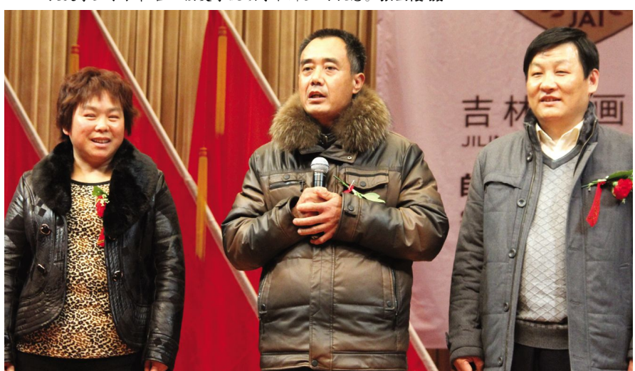
获奖学生家长对学院领导和老师表示感谢。