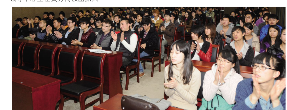
赴台项目推介会受到学生极大关注。