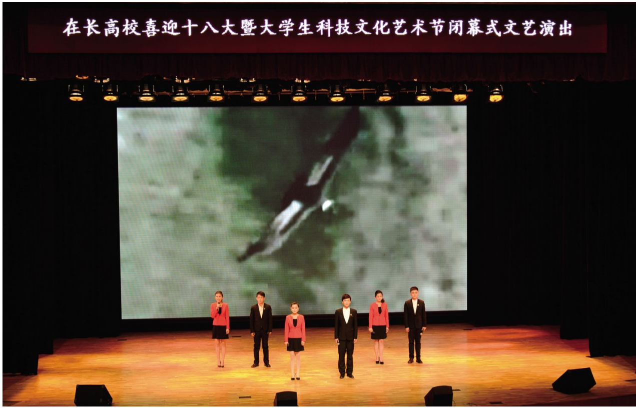
在长高校喜迎十八大暨大学生科技文化艺术节闭幕式文艺演出