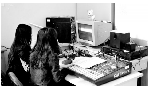
下图:动画之音广播台的播音员正在播出节目。

经进一步准确定位,丰富栏目的新节目有《动画奥斯卡》:采用有声动画的方式,将国际(中文版)、国内获奖动画短片进行原声广播,分享二次元的奇妙奇特,感受动画故事的悲欢离合,品味动画作品的深刻寓意,欣赏动画作品的奇妙魅力,借以提升青年学生的鉴赏能力,激发学生的专业创作欲望。《赛事龙卷风》:及时关注国际国内大学生文艺、体育赛事,及时播报学生参赛获奖情况,表彰先进,树立典型,全面营造良好的学习氛围。《名师零距离》:利用学院丰富的教师、客座教授资源,邀请学院知名专业教师进行在线访谈,解答学生专业难题、就业困惑、职业理想等学生关注的话题。《生活百事通》:寻找身边的生活窍门常识,帮助学生精通生活百事,走近学生,服务学生。《旅游风向标》:拥抱自然,畅游历史长廊,品味各地特色,领略异乡风情,将大自然的神奇与历史文化经典演绎。《我爱我家》:号召学生以走近直播间或以投稿的形式表达对社会、母校、班级、同学的爱。相信动画之音广播台定会借助吉林省高校广播联盟这一新平台,积极营造校园广播健康向上的文化氛围,发挥校园广播文化育人功能,不断丰富和满足青年学生日益增长的精神文化需求,推进学院精神文明建设、活跃校园文化生活。