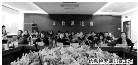
信息检索课比赛现场

本报讯 为提升全省高校文献检索课教师的教学水平,检验和评价信息检索课教学实践成果,由省高校工委组织,2011年12月8日在我院图书馆举办省内民办、高职高专院校信息检索课比赛。整个比赛有来自省内5所民办、高职高专院校的16名参赛选手参与角逐,并有来自部分省内院校的50余名信息检索课