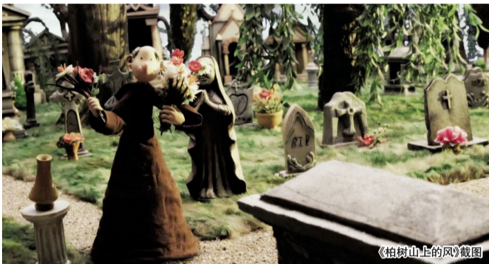
《柏树山上的风》截图