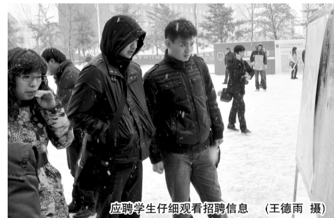
应聘学生仔细查看招聘信息

为进一步做好高校毕业生就业工作,搭建用人单位与毕业生面对面沟通与交流的平台,促进吉林动画学院毕业生进一步提升就业率,2011 年 11 月 26 日,吉林动画学院举行 2012 届毕业生供需洽谈会。图书馆三层大厅热闹非凡,来自全国各地 300 多家用人单位的代表,面对面与 2012 届毕业生洽谈工作。