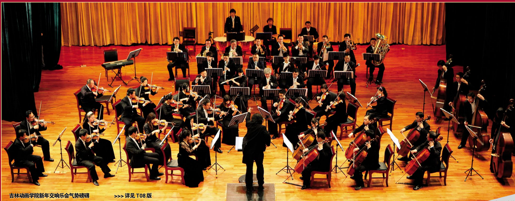
吉林动画学院新年交响乐气势磅礴