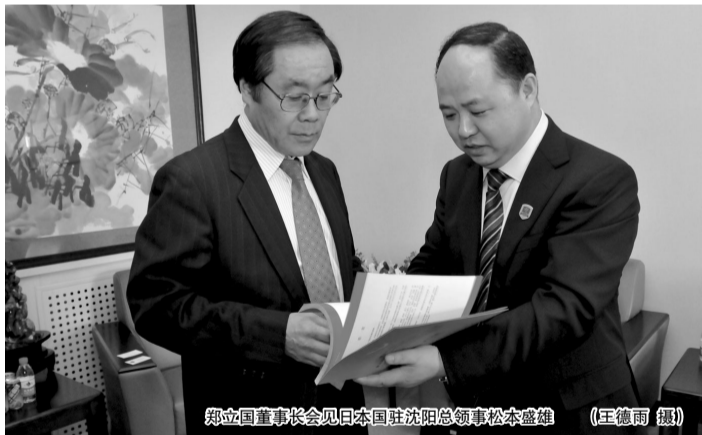
郑立国董事长会见日本国驻沈阳总领事松本盛雄