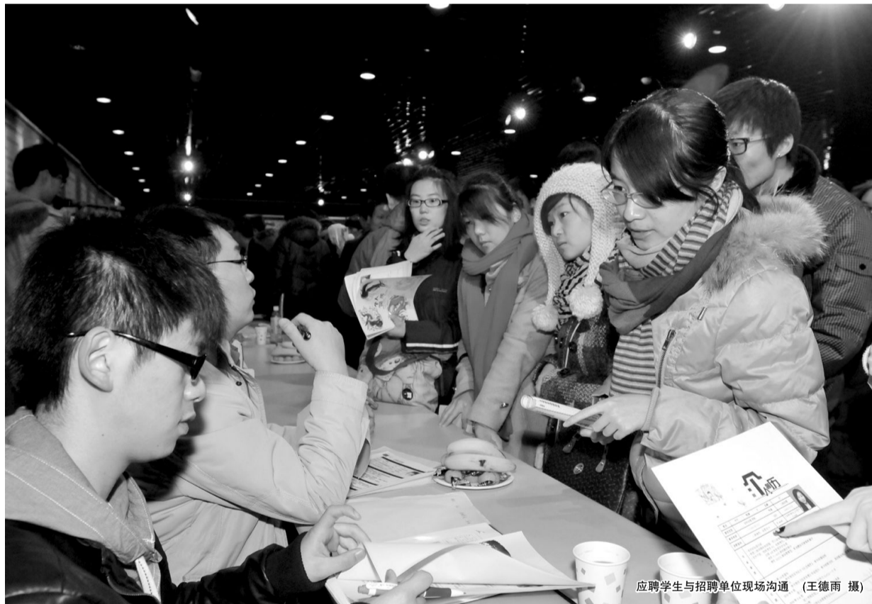
应聘学生与招聘单位现场沟通

供需见面会上,300 多家用人单位看好吉林动画学院 2012 届毕业生,称我院学生肯吃苦,善于思考,动手能力强,有实践经验,有团队精神,建议艺术院校学生找准职业定位,增强文化底蕴,增强艺术修养,增强适应社会的能力。